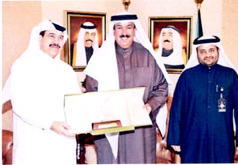
المضف يتلقى التكريم من كاظم | التطبيقي

الجانبين. واشاد المضف بالعمل الذي يقوم به الاتحاد العربي للعمل التطوعي وأهمية العمل التطوعي العربي المشترك وما يحمله من قيمة انسانية ومجتمعية. من جانبه، أعرب الكاظم عن سعادته باللقاء وشكر المضف على حسن الاستقبال، متمنيا تعزيز التعاون المشترك بين الجانبين، ما يسهم في خدمة الشباب والمجتمع ودعم العمل التطوعي.