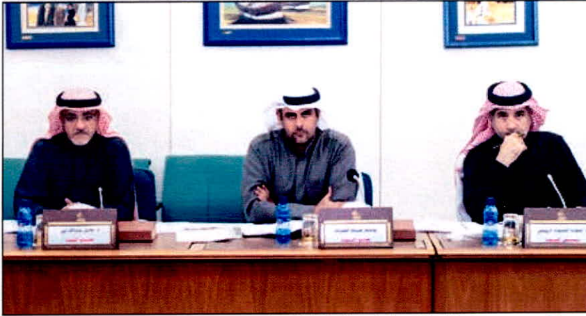
دعوة الرويعي ويوسف الفضالة ودخيل عبدالله أثناء الاجتماع

ناقشت لجنة شؤون التعليم والثقافة والإرشاد في اجتماعها أمس مشروع القانون في شأن الجامعات الحكومية، إضافة إلى عدد من الاقتراحات بقوانين المدرجة على جدول أعمال اللجنة. وقال رئيس اللجنة النائب د.عودة الرويعي إن اللجنة استعرضت اقتراحات بقوانين بتعديل بعض أحكام القانون رقم 28 لسنة 2011 بشأن منح بدلات ومكافآت لأعضاء الهيئة التعليمية الكويتيين بوزارة التربية ووزارة الأوقاف والشؤون الإسلامية. وأضاف أن اللجنة بحثت في اقتراحات بقوانين أخرى بتعديل بعض أحكام القانون رقم 47 لسنة 2005 في شأن إعادة تعيين أعضاء هيئة التدريس السابقين بجامعة الكويت والهيئة العامة للتعليم التطبيقي والتدريب إلى العمل. وأكد الرويعي أن التعديلات تقضي بإعادة الباحث العلمي في معهد